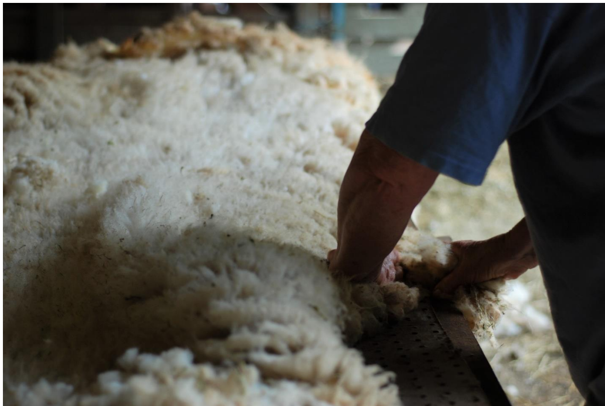
Tri de laine 2022 - Ferme des petites lulus – Théminettes

Une inscription est directement possible en ligne en complétant le formulaire suivant : https://forms.office.com/r/19UhiKHODQ