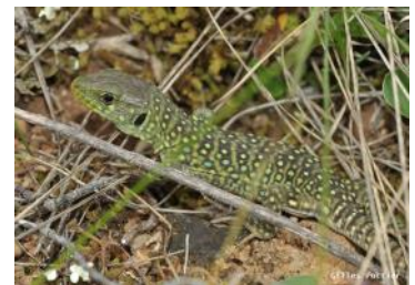
Jeune lézard ocellé

Chez les adultes, le dimorphisme est particulièrement accentué. Les mâles possèdent une tête large et massive, des pores fémoraux développés et la base de la queue est renflée. Les femelles présentent une tête plus petite et moins large.