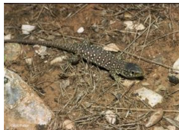
Nouveau-né Lézard ocellé

Chez les juvéniles les taches bleues sont peu marquées et présentent une teinte bleue très claire. Sur le dessus du corps, ils arborent des ocelles blancs bordés de noir, le tout sur une couleur de fond brunâtre.